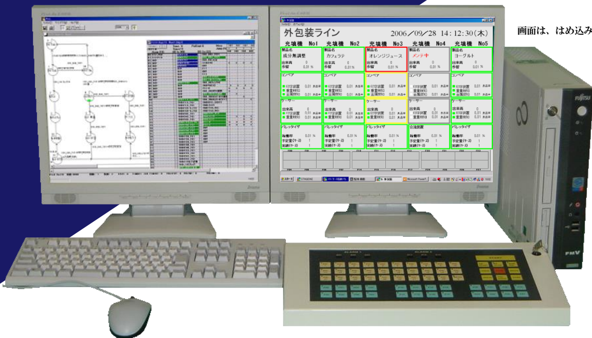
画面は、はめ込み合成です

高速PLC QnUDVシリーズ(三菱電機製)を使用し、更に高速化 しなやかなデータ駆動方式で、コンペア制御が容易に